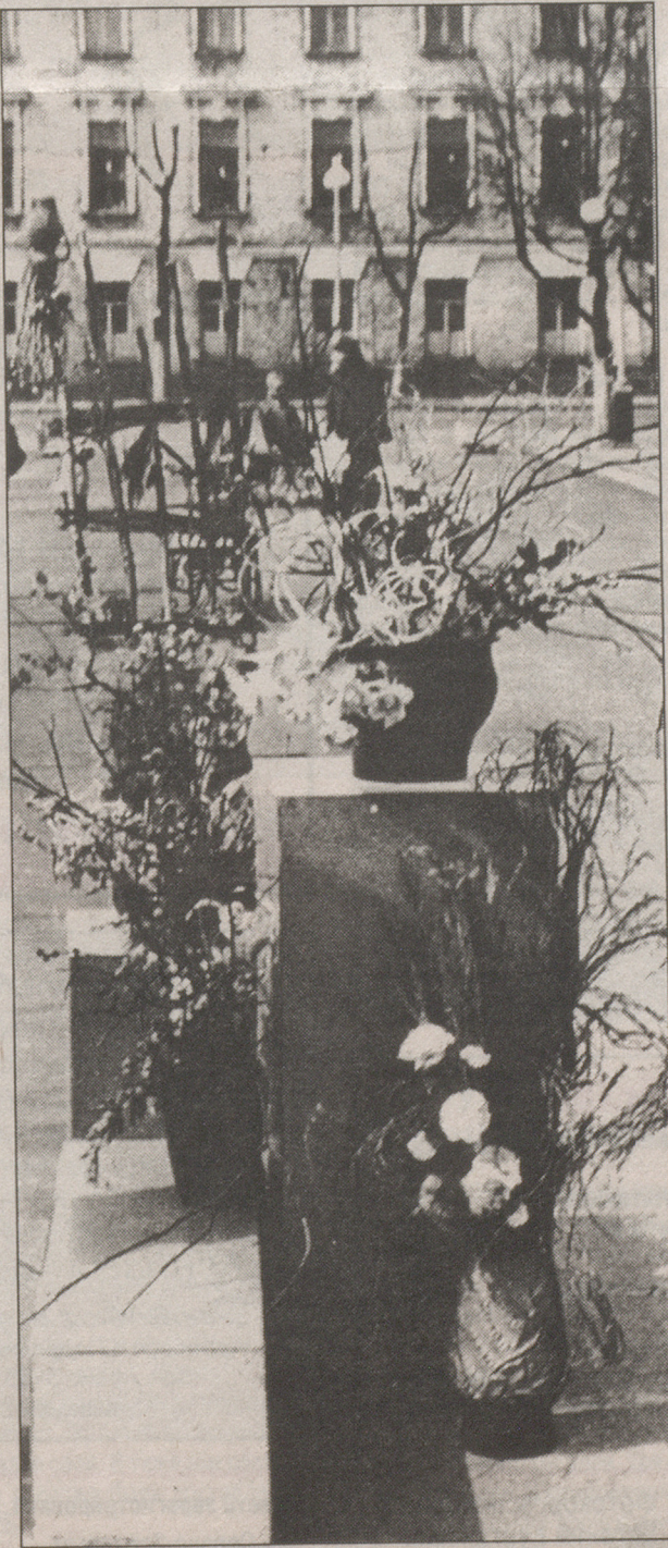
В воскресенье, в светлую Пасху Христову, на пешеходной части ул.Советской клуб аранжировки цветов "Бегония" устроил выставку цветочных композиций. Было, как всегда, красиво. И даже на фоне все еще обнаженных деревьев напоминало о лете.